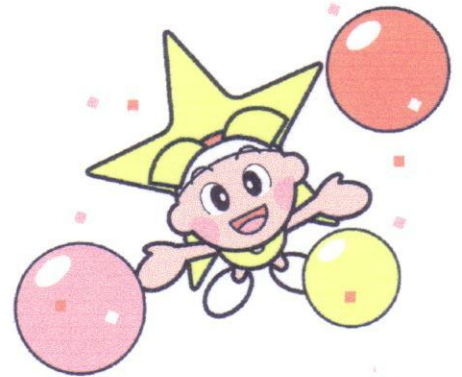
岡山県マスコット ももち