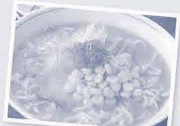
便利なチャックシール付き

商品特徴 北海道十勝産のスイートコーン 原料の産地を北海道十勝地方に限定 した冷凍つぶコーンです。十勝地方の JAの契約農家が栽培したスイート コーンを使っています。製品から栽培 農家までトレース可能なので安心です。 国産、中でも北海道産の冷凍つぶ コーンは市販品でも少なく、CO-OP ならではの商品です。