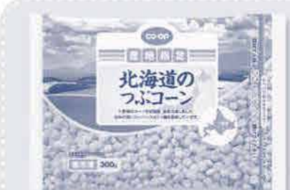
北海道のつぶコーン