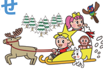
岡山県マスコット「ももっちゃん」と仲間たち

鉄分の含有量は、野菜の中でトップクラスです！さまざまなビタミンやミネラル類を含むため、子どもにもたっぷり摂ってほしい栄養価の高い野菜です。妊娠中の女性も積極的に食べましょう♪ アクが強いことも特徴です。ゆでて水にさらすことで取り除くことができるため、子どもに与える場合は、しっかりとアク抜きをしましょう。