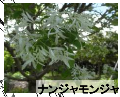
ナンジャモンジャ

・珍樹林ゾーン ハナノキ・ナンジャモンジャ など名前の面白い木や花の珍しい木 を集めやエリアになっています。 (樹種:メクスリノキ・ヒトツバダコなど)