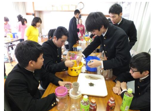
●市民のための環境講座 笠岡アマモ再生教室③