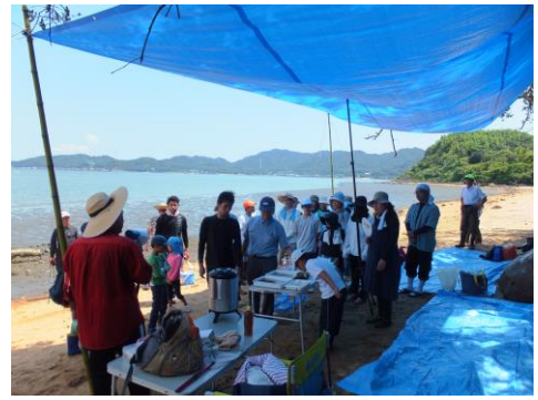
●『高島干潟いきもの観察会』