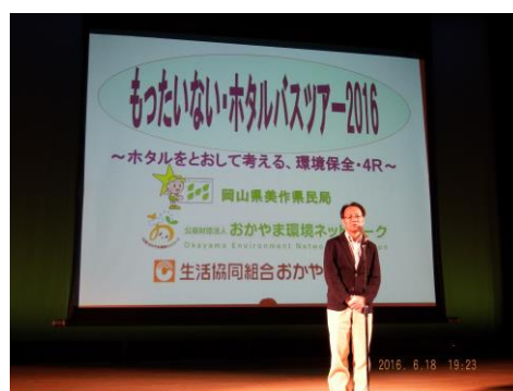
● 『もったいない・ホタルバスツアー2016』