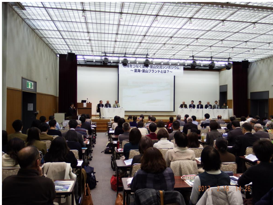
●里海・里山交流シンポジウム