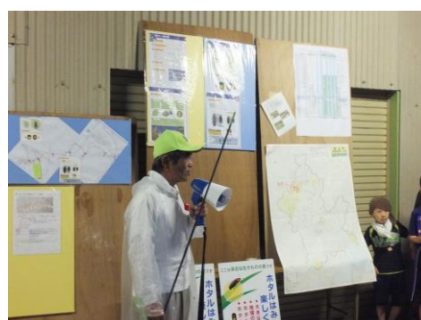
● 『大野川いきもの調査会』