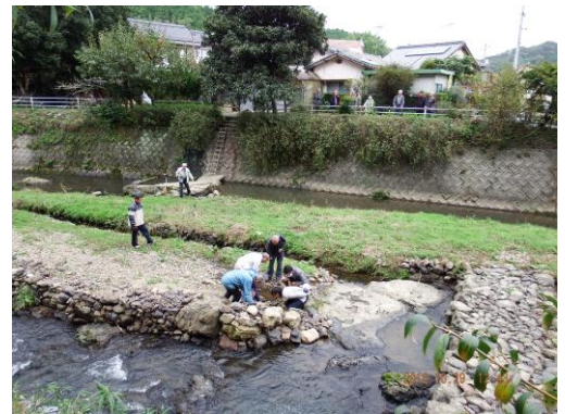
●おかやまホタルフォーラム視察の様子