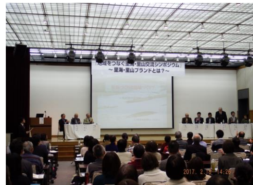
●里海・里山交流シンポジウムの様子