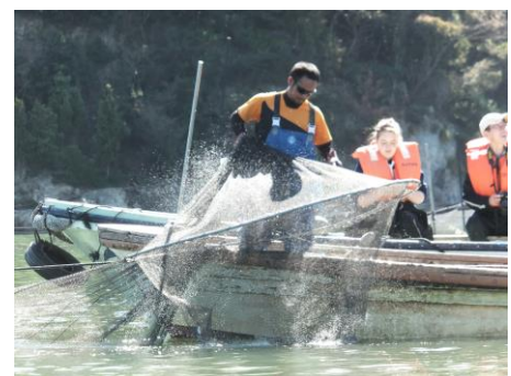
●『つぼ網漁見学～里海の漁法～』