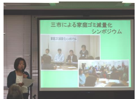
●助成活動報告会の様子

5月14日(土)にオルガにて、岡山県下で環境活動を行う団体や個人が集い、日ごろの活動を紹介してさらなる活性化、相互のネットワーク形成をめざし開催し、35名が参加されました。2015年度助成を受けた全11団体（あかいわ美土里の和、アユモドキ里親会、児島湾研究会、千年の森づくりグループ、あかいわエコメッセ、岡山野生生物調査会、中学校環境研究会、旭川源流大学実行委員会、里海づくり研究会議、共存の森ネットワーク、おかやまコープ井笠エリア）からの報告と、参加者間の質疑応答と情報交換をすすめました。