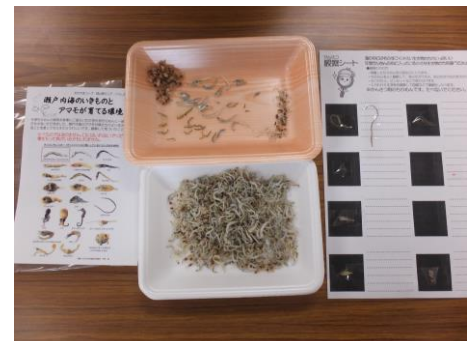
●『瀬戸内海のいきものとアマモが育てる環境学習』 チリメンモンスター

当日は、研究所の概要説明と施設見学、チリメンモンスター（とれたてのチリメンの種別）、海辺のいきもの観察会をしました。