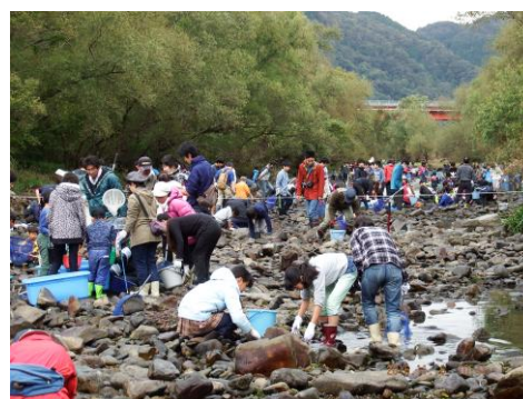
● 『旭川かいぼり調査2016』