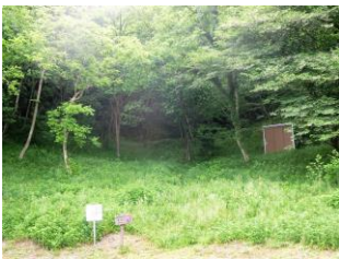
磐山C登山口周辺作業前