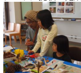
親子でドングリ遊び