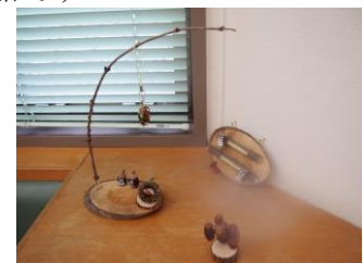
ドングリ遊び完成品