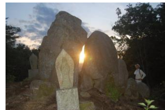
同日予定の観音山頂上の陰陽石スリットに夕日が沈むのを見る会も中止となりました。2日後の夏至の日に会員で鑑賞しました