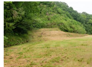
観音山登山口周辺 作業後

③ いっしょにけんこう茶をつくりましょう 6月19日（日） 雨天中止となりました