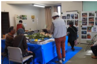
活動展示ワークショップ会場風景