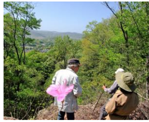
例年ならこの辺りはツツジが咲き乱れているのですが…