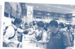
昨年の コープフェスタ 2016の様子

お子さんが楽しめるコーナーもたくさん用意しています。ぜひご家族でお越しください。