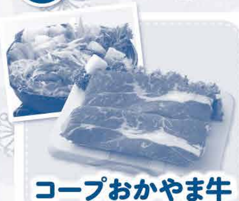
コープおかやま牛