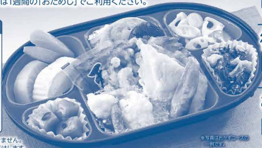
※写真はおかずコースの一例です。

1人様分 1日1食 638円 (税込価格689円) 2人様分 1日1食 597円 (税込価格644円)