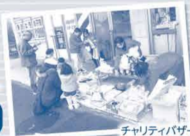
チャリティバザーも 大好評でした。

世界では、約5秒にひとりの子どもたちが予 防可能な原因で5歳の誕生日を迎える前に 命を落としています。おかやまコープでは、 今年度もユニセフの募金活動に取り組みま す。世界の子どもたちに生きるチャンスを届 けるためにご協力をお願いします。