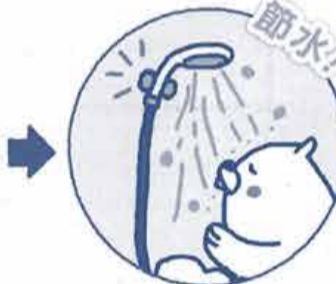
節水タイプのシャワーヘッド

シャワーヘッドを節水タイプに交換すると、勢いはそのまま、水の使用量を削減でき、光熱費も節約できます。