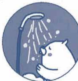
通常のシャワーヘッド

家の中で最もエネルギーの消費量が多いのは「給湯」です。水をお湯に変えるためには、大量のエネルギーを必要とします。そこで、お湯の使用量を節約する「節湯」を心掛けるとエネルギーと水を同時に節約でき、さらに光熱費も抑えられます。