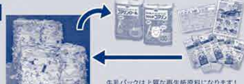
牛乳パックは上質な再生紙原料になります!

おかやまコープは、牛乳パックの回収に中四国9生協の中で最も早く取り組みました! これからも協力をよろしくお願いします。