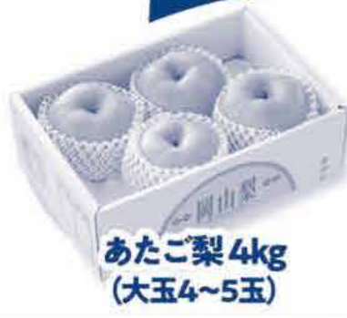
あたご梨 4kg (大玉4~5玉)