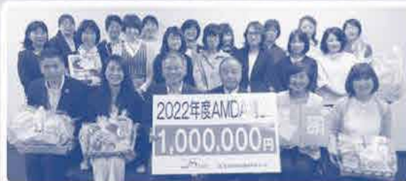
募金贈呈式の様子