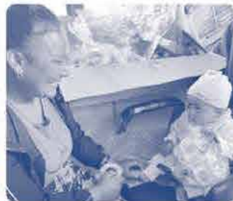
ネパール母子健康格差是正事業 手作りプレゼントに笑顔の母子