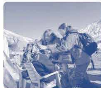
トルコ地震被災者緊急支援活動 村を訪問し健康チェックを行う AMDA医師と看護師