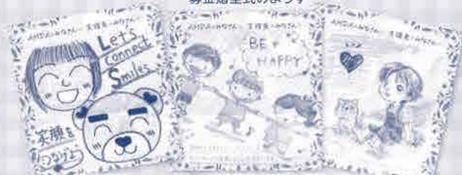
あたたかいメッセージをありがとうございました♪