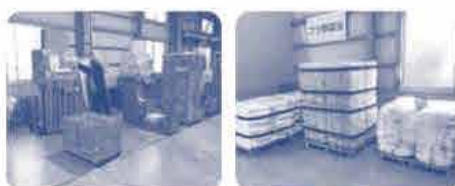
プラスチック類は、100円均一のプリンターなどの 商品にも再生利用されているよ!!

★ 牛乳パックをキレイに洗って出してもらえているのでとてもよい状態でリサイクルに出せているそう!!