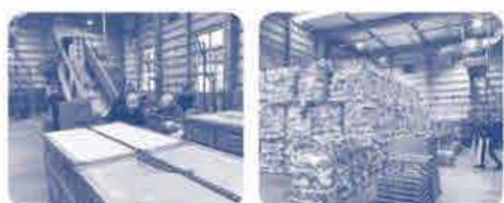
カタログ → 牛乳パック → OCR用紙(注文用紙)