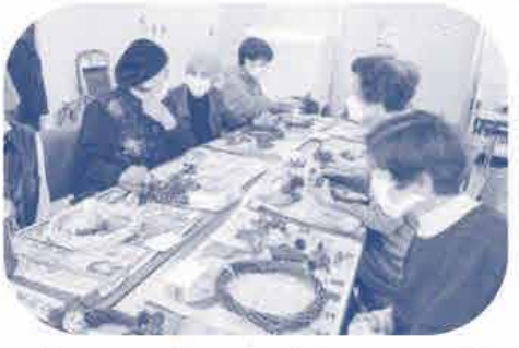
加茂川 コ-プ委員会 《なごやかな雰囲気楽しかったです》