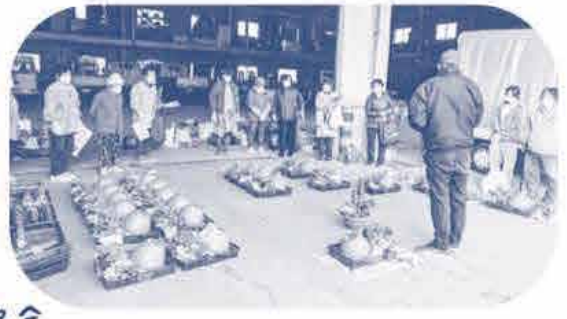
高梁北コ-プ委員会 《たくさんの方に参加してもらえました》