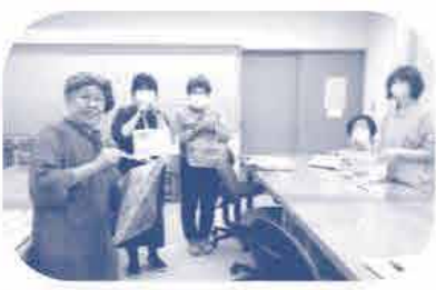
神郷・碓西 コ-プ委員会 《かぼすジュースも試飲しました》