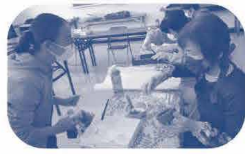
新貝北 コ-プ委員会 《日本古来の手芸-間張りてがわを作りました》