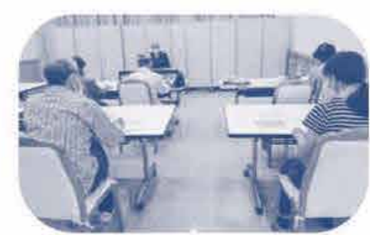
山手 コ-プ委員会 《コロナ後の葬祭を参考になりました》