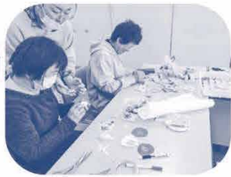
高梁中央 コ-プ委員会 《くるみボタンを作りステキな ネックレスが完成しました》