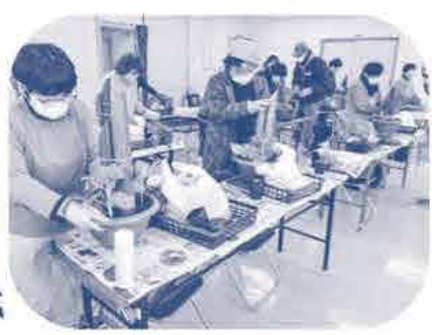
新貝南 コ-プ委員会 《おすすめ商品の数の子を試食しました》