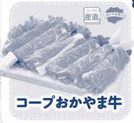
コープおかやま牛

エサにこだわり おかやまコープ独自の配合飼料を使用。 分別生産流通管理済みトウモロコシ ※1 だから 安心。WCS(飼料用米)と飼料用米も使用し、 食料自給率アップの取り組みも行っています。