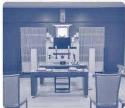
(エヴァホール総社の施設の見学もしました。)

参加者の感想 ・両親が元気なうちに遺言書のことなど話してみたいと思います。遺言書があるのが前提という話、初めて聞いておどろきました。 ・質問の中で、色々な事例を話して頂いてわかりやすかった。 ・講演をさかせていただいて、今後の参考にしたいと思います。