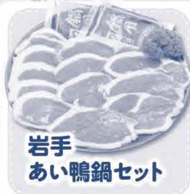
岩手 あい鴨鍋セット