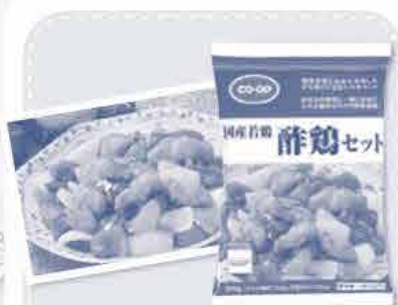
国産若鶏酢鶏セット

コープCSネット5会員生協の組合員が参加して開発された第1号商品。「家族に野菜を多く摂らせたい」「アレンジメニューやかさ増しができるもの」「夕食のおかずで手早く簡単に調理できるもの」など、組合員の声から生まれた商品です。