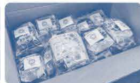
12月末から1月初旬ごろに対象の組合員家庭へお届けされる予定です。