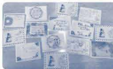
組合員からいただいた温かいメッセージカード。

「コープいしかわ」より全国の生協に協力の呼びかけがあり、今回の募金を活用し「コープいしかわ」の被災された組合員家庭に、「恩納村産もずくスープ」と「瀬戸内レモンのレモネード」100セットを皆さんから寄せられたメッセージカードと一緒に贈りました。