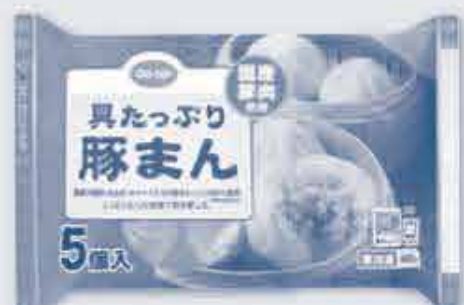
具たっぷり豚まん