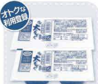
恩納村産 味付太もずく