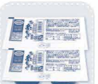
恩納村産 味付糸もずく

美味しさのひみつ 沖縄県恩納村産のもずくを、かつお節エキスを加えた三杯酢で味付けしました。調味料の持ち味を生かしたあっさりまろやかな味で、好みの野菜等を加えてもおいしくお召し上がりいただけます。