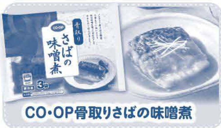
CO・OP骨取りさばの味噌煮