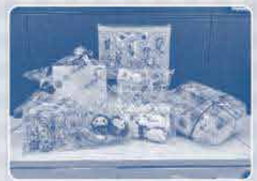
エリアの企画で つくった 手作りおもちゃ

2026年度からネパールでの支援が「母子健康格差是正事業」から「乳がん・子宮頸がん検診体制強化支援事業」に変更になります。