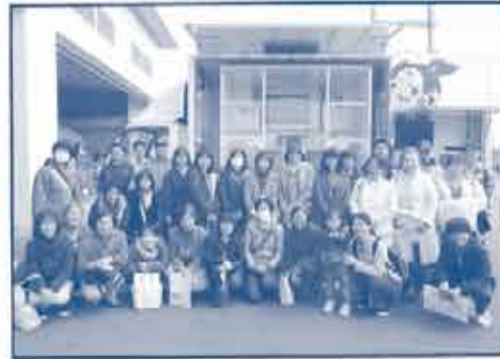
△いっしょに学ぼう！防災・減災 知恵ぶくろ 参加者のみなさん

災害が少なく、暮らしやすい岡山では災害時の備えや心構えをしている家庭が少ないと言われています。東日本大震災より6年が経過し震災の記憶が風化しつつある中、改めて学ぶことで防災意識を高め、自らの備えにつなげようと三月十日、岡山市東消防署で防災・減災を考える企画を開催し、親子26人が参加されました。