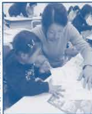
△防災手帳作ったよ

震災発生時の映像を見て、その恐ろしさを痛感し、実際に救援に行かれた消防士さんのお話を聴き、大きな家具の固定や消火器の準備、水、非常食、消火薬などの日常のちょっとした備えが、家族の命を守ることに繋がることが学びました。その後の救急法や地震体験車での経験で、防災知識を持ってまわりに声をかける大切さも知りました。