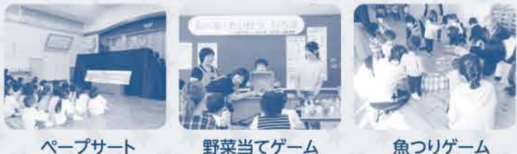
ペープサート 野菜当てゲーム 魚つりゲーム

活動内容 県内各地で開催される「たべる・たいせつ出前授業」で ペープサートや食育ゲームを実施します。