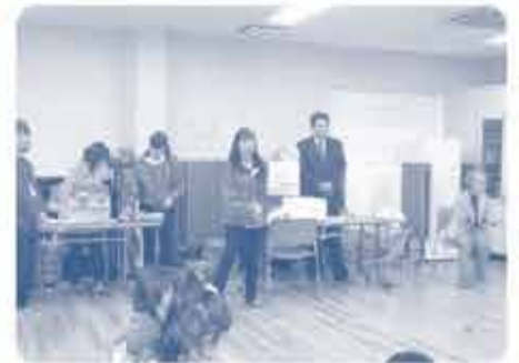
東岡山センターの職員さんから、アレルギー対応のチラシ「ふあみ〜ゆ」を紹介していただきました。また、アレルゲンのないおやつを試食しました。