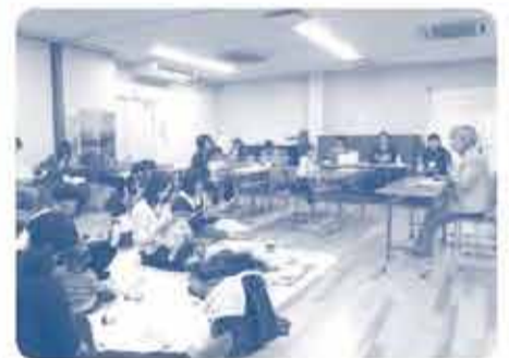
参加者の方から「初めて知った事もあり、良かった。」「また参加したい。」と感想が寄せられました。