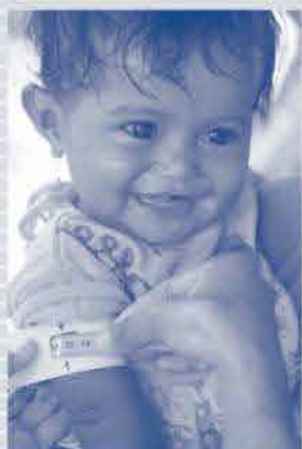
巡回診察で 発育観測を受ける 東ティモールの女の子

世界では、5歳の誕生日を迎える前 に、年間540万人の子どもが命を 落としています。その原因の多く は、安全な水やワクチンがあれば 簡単に防ぐことができるものです。 あなたの募金が子どもたちの支援 に役立ちます。