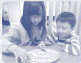
ならべたり デコったり