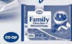
ファミリーチョコレート 200g