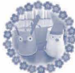
クリスマスが近かったのでサンタやトナカイを作りました