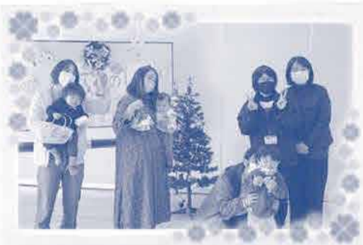
みんなで記念写真!