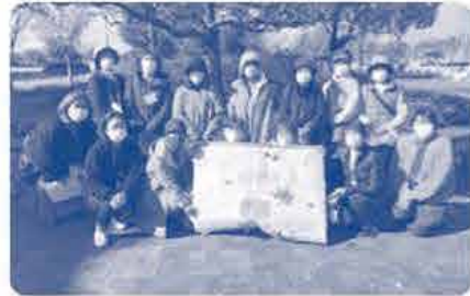
たくさんの参加ありがとうございました!