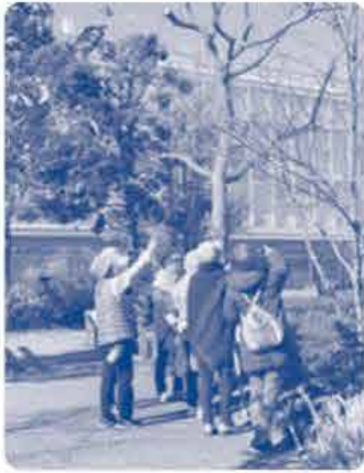
天気が良く気持ちいい～

11月24日(水)に西大寺緑化公園内を散策しました。新型コロナウイルスの影響で開催できるか どうか心配でしたが、当日は16人の参加があり、クイズや公園内の木々と触れ合いながら和気あい あいと楽しい時間を共有できました。