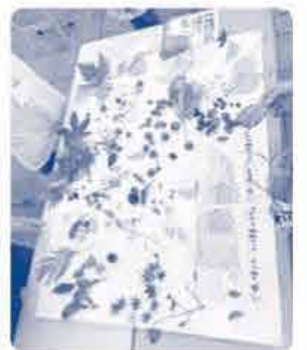
いろいろな種類のお花や 木の実に出会いました!