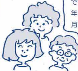
コープ委員さんたち

「コープのたね」という冊子にそって話を進めています。 でも、ほとんどが井戸端会議みたいな感じです。 年代に関係なく、ちょっとしたことを相談できたり、月に1回、人と話すのがとても気分転換になって、元気の素になっている気がします。