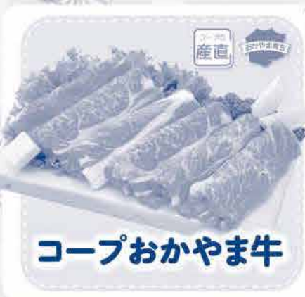
コープおかやま牛

こだわりのポイント エサにこだわり おかやまコープ独自の配合飼料を使用。 NON-GMO※1・PHFコーンだから安心。 WCS(飼料用稲)と飼料用米も使用し、食料 自給率アップの取り組みも行っています。