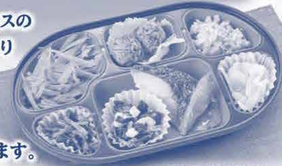
※写真はおかずコースの一例です。