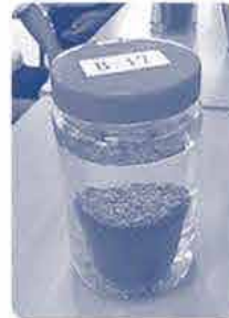
今回はペットボトルで作成。