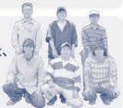
農事組合法人 伍協牧場のみなさん