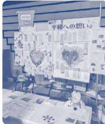
各生協の展示ブース

2日間の活動を通して、核兵器の恐ろしさや被爆の実情を知るとともに、戦後70年経った今でも、癒されぬ被爆者の方々の悲しみや苦しみに触れました。知らないことも多くて、自分の「平和」に対する想いが薄っぺらなもののように感じられましたが、正しく知ることによって、少し厚みがついた気がしています。残念ながら、世界は今「平和」とは程遠い状況ですが、これからの生活の中や組合員活動を通して、自分に出来ることから平和に対する想いを繋げていきたいと思っています。