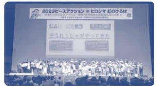
虹のひろば合唱団による 「ぞうれっしゃがやってきた」の合唱の様子