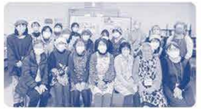
25名の参加がありました

11月21日にコープ西大寺で コープ産直こめたまごの こだわりポイントをお知らせして お手軽メニューを調理し 美味しさを実感しました