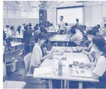
「平和とは何か？」を みんなで考えるワークショップ