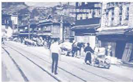
自分のアバターで 被爆直後の焼野原を探索