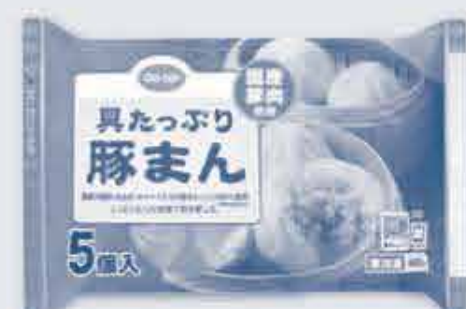
具たっぷり豚まん