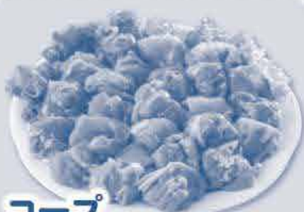
コープ おかやま若鶏