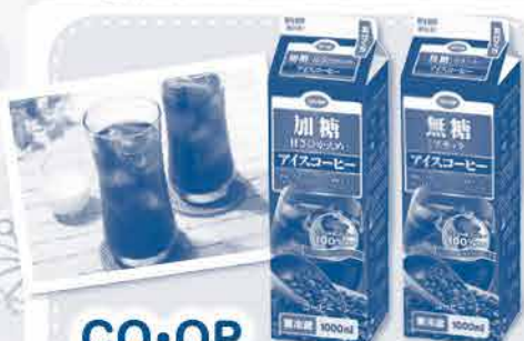
CO-OP アイスコーヒー(加糖・無糖)

酸味と苦みのバランスを考え、ブラジル産のアラビカ種とロブスタ種をブレンドしたコーヒー豆を、アイスコーヒーによく合う深煎り焙煎にしました。甘さ控えめの加糖タイプと、ほろ苦いコーヒー本来の味わいが楽しめる無糖(ブラック)。お好みに合わせてお召し上がりください。