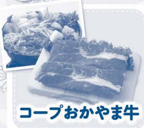
コープおがやま牛