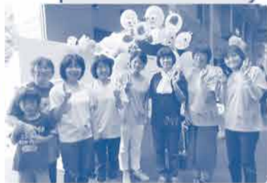
みんなでブースを盛り上げました!!