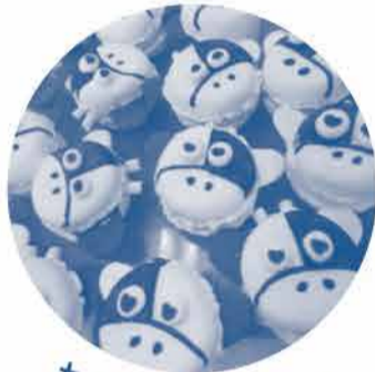
新作 M&M& マカロン 合言葉は「コープおがやま牛だんごすま!」 子どもはもちろん大人にも好評でした

今年は、JA全農おがやまさんと美作エリアさんと一緒におがやま牛、おがやま豚のブースを盛り上げました。井笠エリアはおがやま牛の試食「牛肉とトマトのオムレツ炒め」を提供しました。計200食が、あっという間になくなりました。