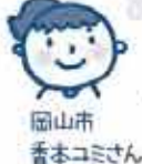
岡山市 香本コミさん

低価格で使用時も良いです。まとめた買い方で、配達場所まで宅配してもらえるので選ぶ手間が省けます。 本当に長く使えます。ペーパーを引き出す時も途中で切れたりせず、ストレスなく使えます。