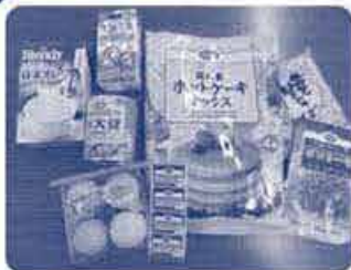
この商品で作ってみました