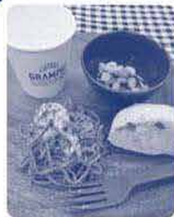
おもしろい!!撮影する人もいっぱい!