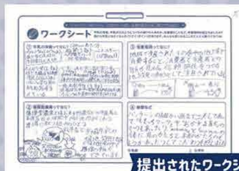
提出されたワークシート

ワークシートには、いろいろな視点で調べられた結果が記入されており、CO-OP商品のこだわりの理解につながりました!