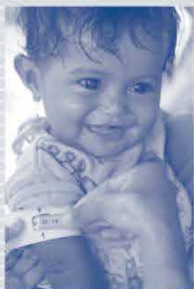
巡回診察で 発育観測を受ける 東ティモールの女の子

世界では、5歳の誕生日を迎える前 に、年間540万人の子どもが命を 落としています。その原因の多く は、安全な水やワクチンがあれば 簡単に防ぐことができるものです。 あなたの募金が子どもたちの支援 に役立ちます。