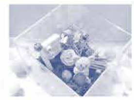
大きさは10cm×10cmくらい この作りがある わかりますか？

気軽に集まって、楽しく情報交換できる 知り得café。今回は「テラリウム」に挑戦!! かたくり貝は準備されているので、あなた好みに配置すれば できあがりです。 COOP商品のお菓子も試食しながら、おしゃべりしましょう。 お楽しみに...。