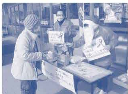
ウーフリーコープの記事が封筒を作って届けてくださった方もいます