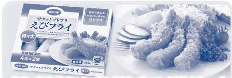
CO・OPサクッとプリプリえびフライ(約12cm)